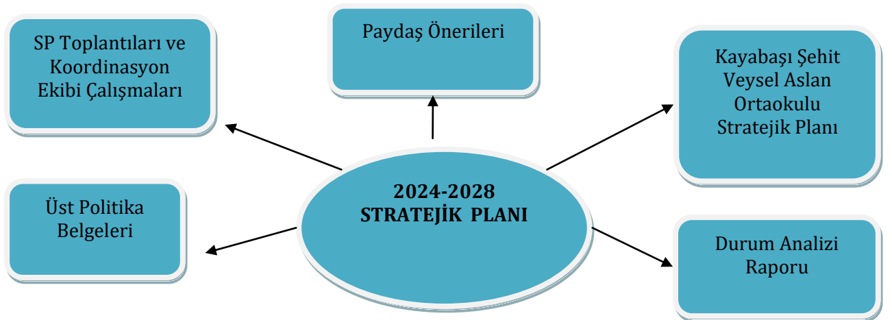
Şekil1: Büyük Kızılca Ortaokulu Stratejik Planlama Süreci